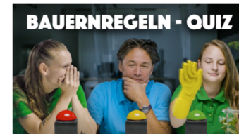
Bauernregeln Quiz - Projekt Landi